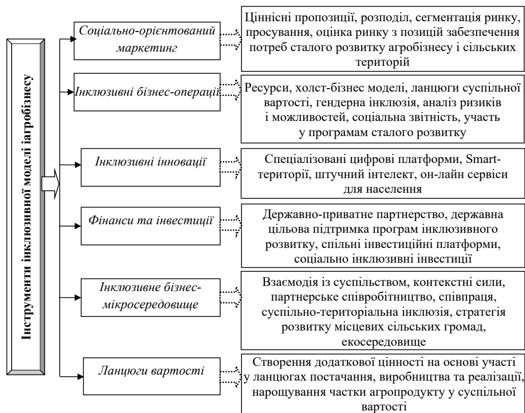
Рис. 1. Інструменти інклюзивної моделі агробізнесу