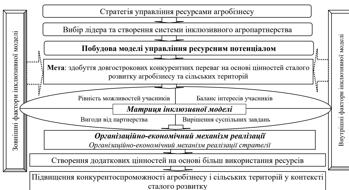
Рис. 3. Концептуальна модель інклюзивного управління ресурсним потенціалом агробізнесу

Центральним елементом інклюзивної моделі управління ресурсним потенціалом аграрних бізнес-суб'єктів є матриця, що поєднує базові інструменти і методи використання ресурсів агросфери: 1) забезпечення рівності можливостей, перспектив, ризиків діяльності для всіх учасників інклюзивного проекту; 2) механізм справедливого та взаємовигідного партнерства; 3) досягнення балансу індивідуальних та спільних інтересів учасників моделі; 4) реалізація бізнес-цілей участі та створення можливостей для досяг-