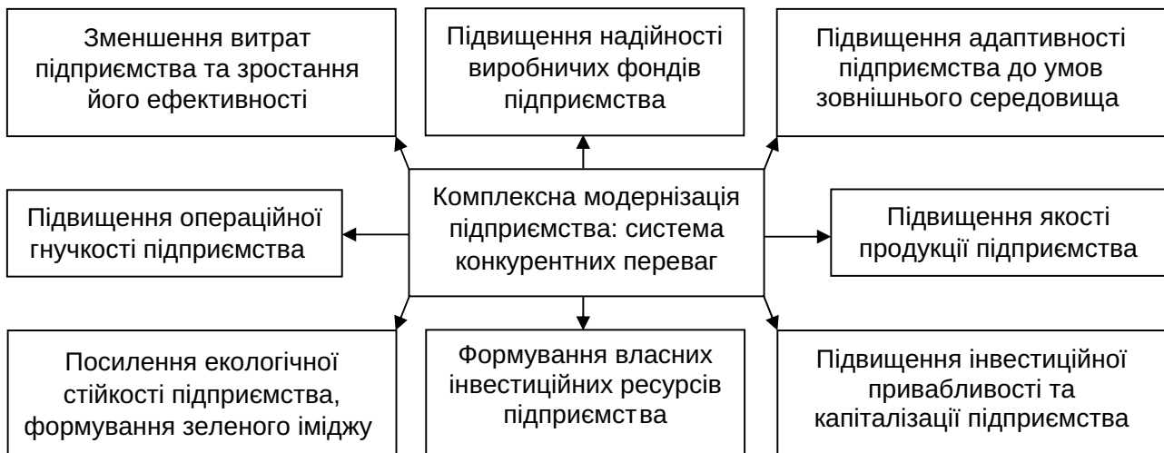
Рис. 2. Система основних конкурентних переваг підприємства при його комплексній модернізації

в довготерміновій перспективі та в кінцевому підсумку – створити передумови активізації процесів саморозвитку підприємства. Стійкість до впливу зовнішніх дестабілізуючих факторів та схильність підприємства до саморозвитку є інтегрованим ефектом модернізації.