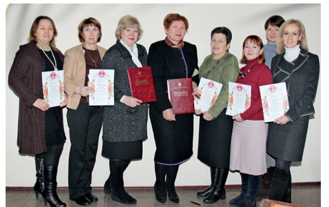
Викладачі кафедри українознавства після нагородження