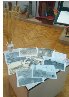
Експонати музею історії ПДАБА

представлених експонатів – це фотографії. На кожному знімку – ціле життя. Багато фото зроблені в ті часи. Також книги, написані чорнобильцями: поезія, проза, спогади і роздуми. На окремих стендах – малюнки дітей. Маленькі художники по-дорослому поглянули на минулу трагедію.