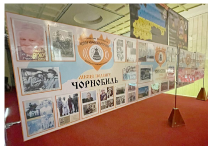
Виставка в музеї імені Д. І. Яворницького

Четвертий реактор, який має назву «Укриття», усе ще зберігає в своєму свинцево-залізобетонному лоні близько 200 тон ядерних матеріалів. Наскільки ще вистачить роботи саркофагу? На це ніхто не відповість. До сих пір неможливо дістатися багатьох вузлів і конструкцій, щоб дізнатися, який у них запас міцності. Проте усі розуміють, що руйнування «Укриття» призвело б до наслідків навіть страшніших, ніж