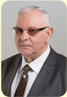
Доктор технічних наук, доцент, зав. каф. Технології будівельних матеріалів, виробів та конструкцій

Ректорат, профком, Студентська рада, редакція газети «МБ»