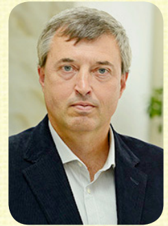
Кандидат наук з фізичного виховання і спорту, доцент, завідувач кафедри Фізичного виховання і спорту