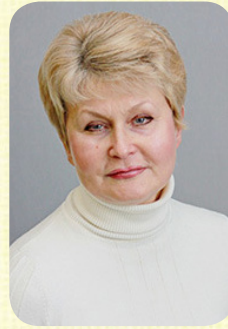
Старший викладач кафедри Архітектури