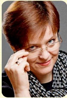
Кандидат технічних наук, доцент, зав. каф. Комп'ютерної науки, інформаційні технології та прикладна математика