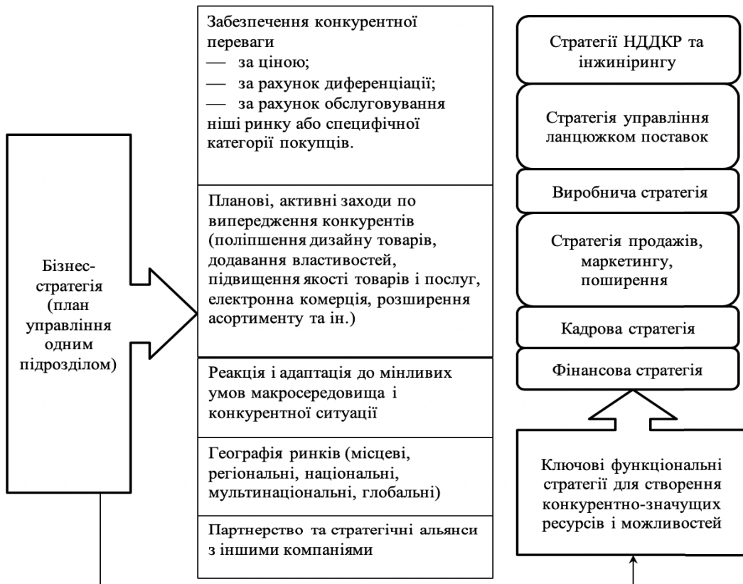
Рис. 3. Створення стратегії для однопрофільних компаній

Бізнес-стратегія містить наступні елементи.