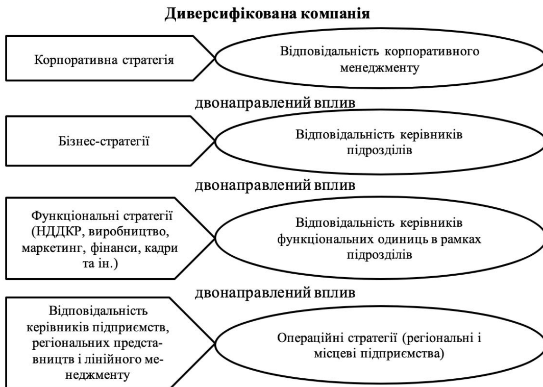
Рис. 1. Етапи розробки корпоративної стратегії диверсифікованої та бізнес стратегії однопрофільної компанії

Корпоративна стратегія - це загальний план управління диверсифікованою компанією, що описує дії по досягненню певних позицій в різних галузях і підходи до управління окремими видами діяльності. На рис. 1 представлені основні елементи стратегії диверсифікованої компанії. У корпоративній стратегії повинні бути відображені чотири найважливіші напрямки.