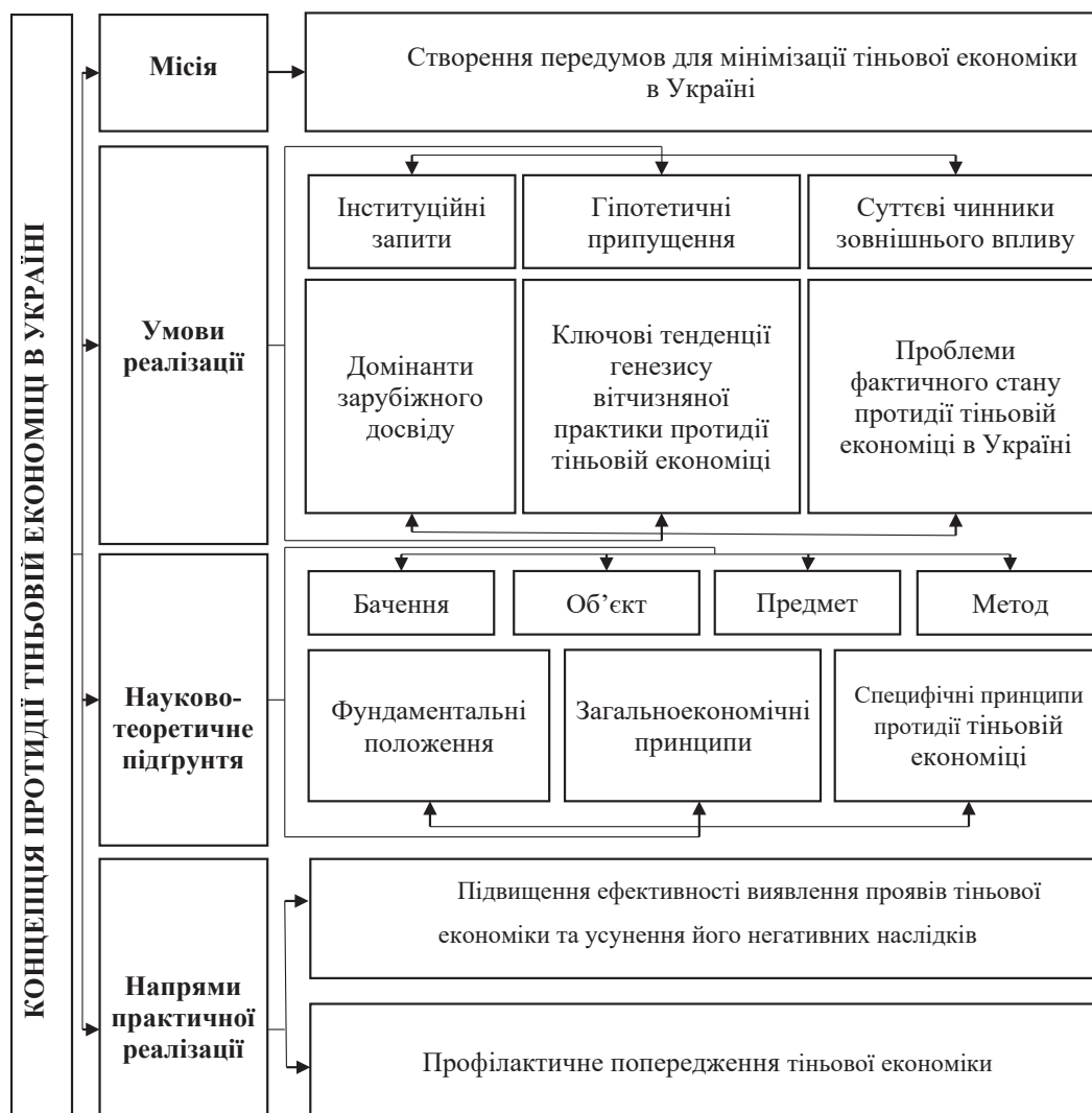
Рис. 1. Інтегральний показник рівня тіншової економіки в Україні (у % від обсягу офіційного ВВП) за 2010 р. – січень-червень 2021 р. [2]

– створення єдиного інформаційного ресурсу державного рівня з метою посилення взаємодії