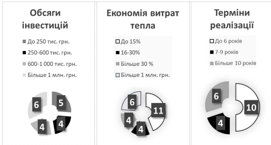
Рис. 2. Аналіз параметрів реалізованих ЕСКО-контрактів за 2016 рік

Виходячи з проаналізованих даних, можемо стверджувати, що ринок ЕСКО-договорів є доволі перспективним і має позитивну тенденцію розвитку. Наразі він перебуває на етапі формування, оскільки перші пілотні проекти дозволяють оцінити його потенціал та привабливість для інвесторів, а також унормувати законодавство в цій новій сфері публічно-приватного партнерства.