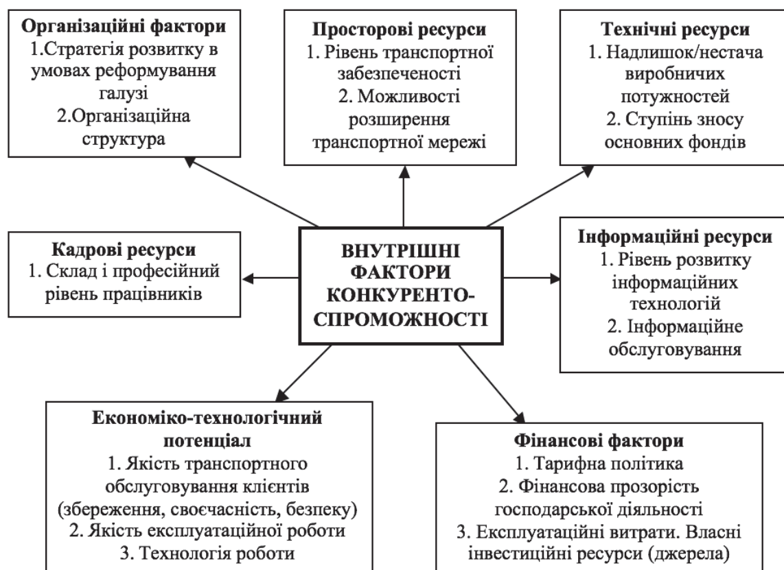
Рис. 4 Внутрішні чинники, що впливають на конкурентоспроможність транспортної продукції

Аналіз впливу зовнішніх та внутрішніх факторів на конкурентоспроможність інфраструктурних об'єктів дає можливість: знизити рівень невизначеності й ризику в процесі діяльності; підвищити якість стратегічного планування й прогнозування діяльності об'єкта; підвищити рівень конкурентоспроможності об'єкта; зберегти конкурентні позиції та збільшити частку ринку.