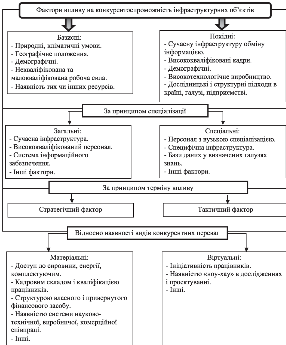
Рис. 1. Фактори впливу на конкурентоспроможність інфраструктурних об'єктів