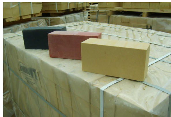
Рис. 8. Різноманітність кольорів вихідного продукту

Комплексними в'язучими з активними компонентами у вигляді золи зміцнюються піщано-щебенові ґрунти, одержувані подрібненням маломіцних вапнякових і піщаних (або інших) порід, дерева вивержених і метаморфічних порід, відходи після дробіння каменю або великоуламкові відходи промислових підприємств.