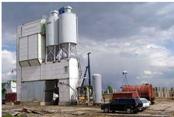
Рис. 6. Цех золи виносу для бетону

Проблема утилізації золошлакових відходів може бути вирішена за допомогою технології TITAN HYPERPRESS, вартість перетворення однієї тони золошлакових відходів на цеглу приблизно відповідає 20 євро.