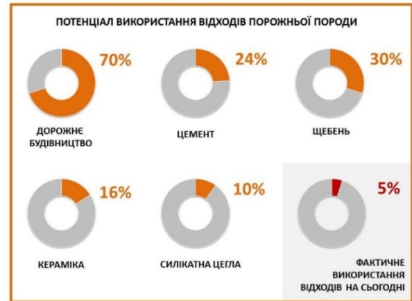
Рис. 7. Потенціал використання відходів порожньої породи

Проблема утилізації золошлакових відходів може бути вирішена за допомогою технології TITAN HYPERPRESS, вартість перетворення однієї тони золошлакових відходів на цеглу приблизно відповідає 20 євро.