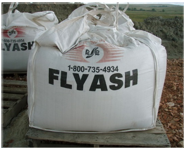
Рис. 3. Зола сухого вловлювання