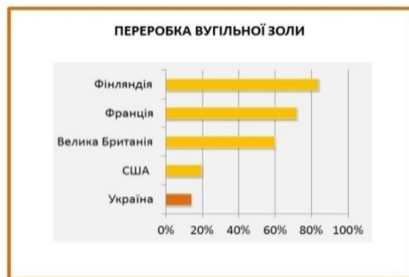
Рис. 1. Дані Європейської асоціації продуктів згоряння вугілля щодо переробки вугільної золи

копалин – це карбонати, сульфідні і глинисті матеріали, які зазнають у процесі термічної переробки значних перетворень.