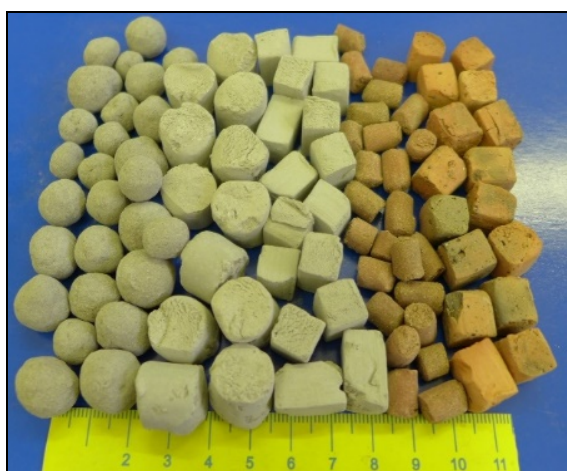
Рис. 4. Мікросфери

Сьогодні золовідвали української теплогенерації заповнені на 50 %, а в деяких випадках і зовсім на 95 %. Наприклад, наразі ТЕС компанії ДТЕК щорічно продукують близько 5 млн т вугільних відходів. Нескладно порахувати, що за таких темпів можливості для їх зберігання будуть вичерпані вже через 5–10 років. На деяких підприємствах ця ситуація ще гірша – їх золовідвали будуть переповнені всього через 3–4 роки.