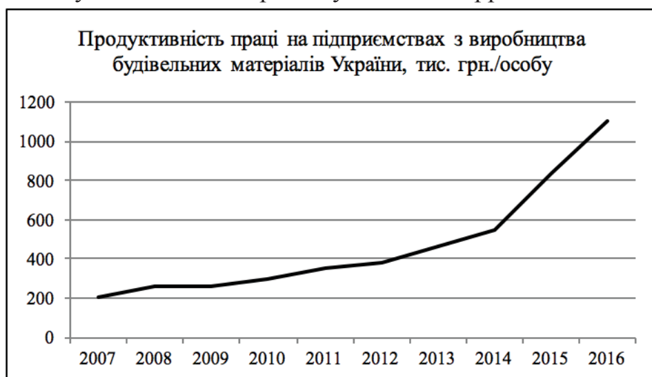
Рис. 2. Динаміка продуктивності праці на підприємствах галузі у 2007-2016 рр.

Загальновідомо, що заробітна плата повинна залежати від продуктивності праці. Динаміку продуктивності праці на підприємствах з виробництва будівельних матеріалів у 2007-2016 рр. наведено на рис.2.