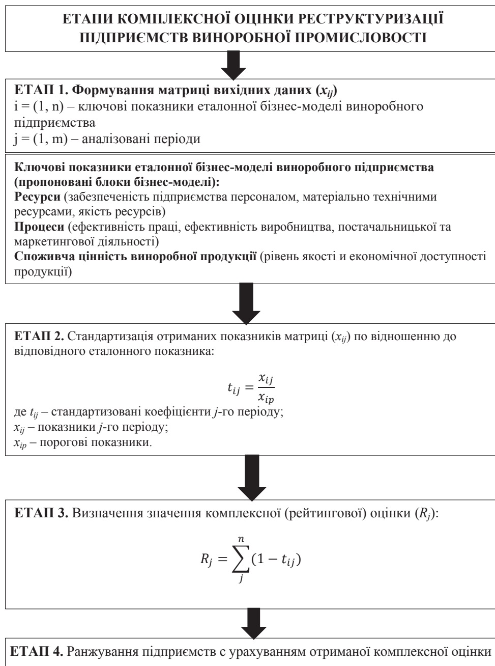
Рис. 2. Алгоритм комплексної оцінки реструктуризації підприємств виноробної промисловості