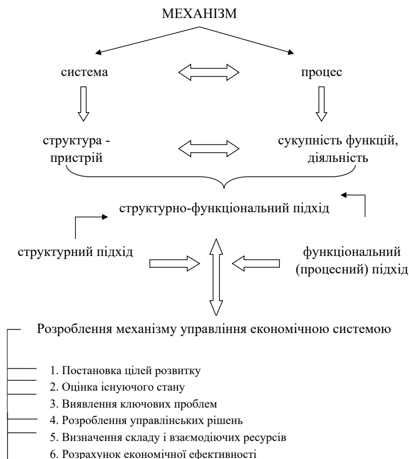
Рис. 2. Дуальність поняття «механізм»

Найбільш узагальненим є поділ методів на організаційно-управлінські, нормативно-правові, фінансово-економічні. Правові методи регулювання зовнішньої торгівлі знаходять своє відображення в системі законодавчої бази, яка регулює відносини між суб'єктами, встановлюючи інституційний устрій.