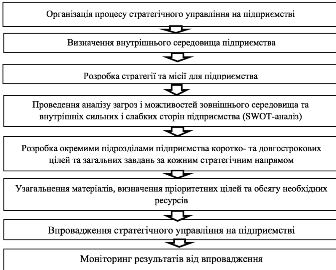
Рис. 2 Методологія впровадження стратегічного управління на підприємстві

керівники підприємства забезпечують його розвиток та створення конкурентних переваг для забезпечення в майбутньому прибутковості суб'єкта господарювання. Методологія впровадження на підприємстві стратегічного управління зображена на рис. 2.