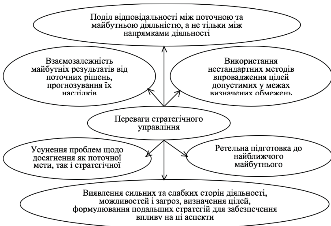
Рис. 3 Визначальні переваги стратегічного управління на підприємстві

розвитку та координації усіх виробничо-господарських процесів. Формування стратегії дає можливість сформулювати напрями та способи досягнення поставлених цілей. Але навіть у випадку впровадження комплексу необхідних умов для їх реалізації, можуть виникати певні труднощі та проблеми, які є наслідками, що можуть призвести до кризового стану підприємства. Врахування визначених обмежень та вирішення поставлених проблем, пов'язаних з необхідністю розвитку будь-якого підприємства, розробка та впровадження методологічних основ стратегічного управління підприємства є вимогою певного проміжку часу.