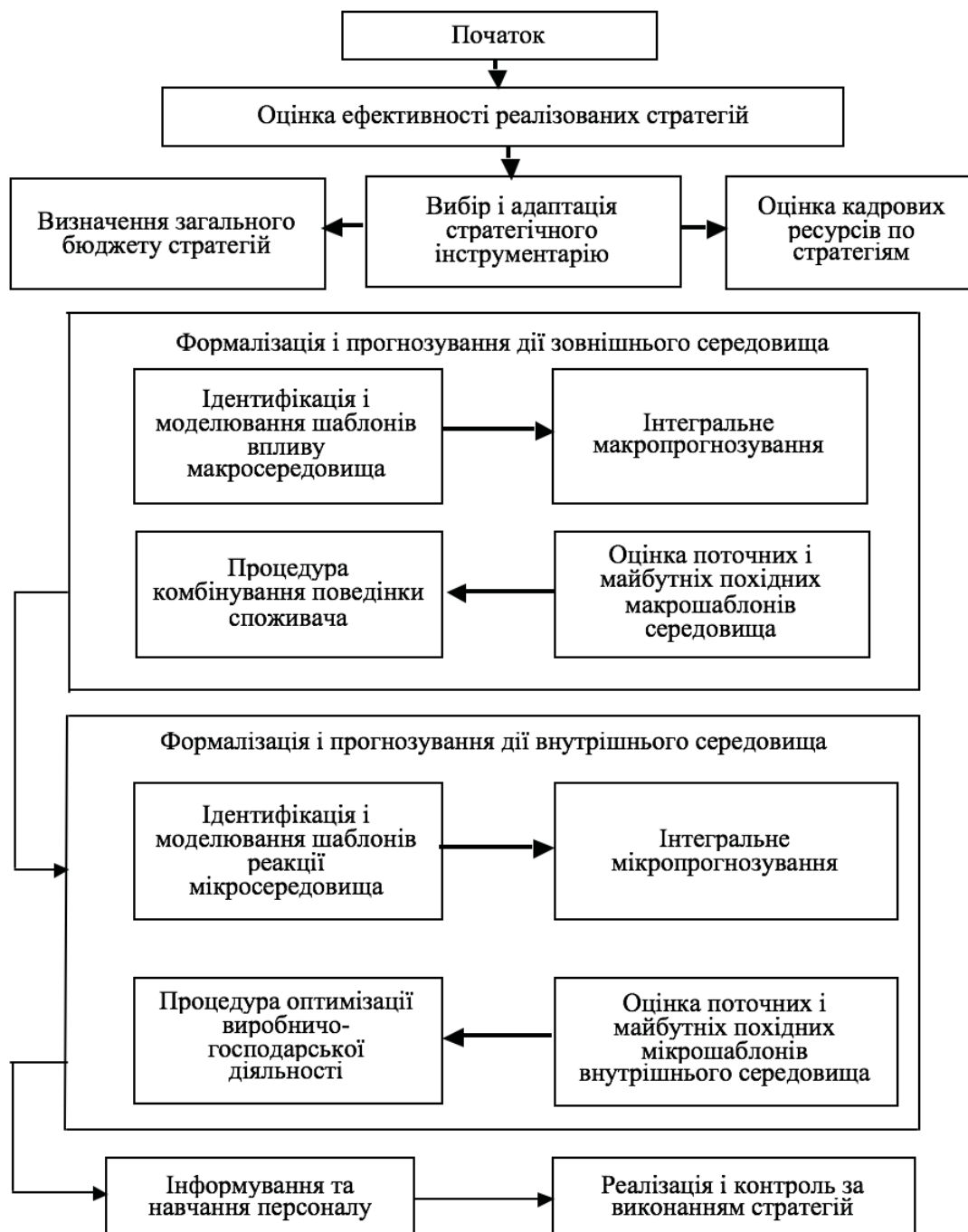
Рис. 4 Структурно-логічна модель удосконалення процесу стратегічного управління

ступеня формалізації, специфіки, ефективності та інструментальної бази.