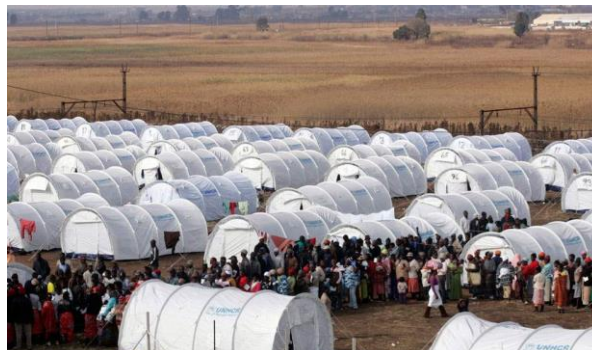
Рис. 2. Палаточный лагерь беженцев

В современных условиях мобильные дома имеют разнообразный типологический диапазон. Месторасположение жилых мобильных образований