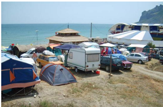
Рис. 1. Мобильный кемпинг

О передвижных поселениях известно с глубокой древности. В различные периоды размещение мобильных жилых систем относительно поселений оседлых обитателей было различным. Известны примеры присутствия передвижных жилищ в среде капитальных строений, однако более характерной была концентрация походного жилья на свободных открытых пространствах, вне сформировавшихся жилых территорий; на месте многих временных поселений впоследствии возникала постоянная застройка (римские палаточные военные лагеря и т.п.) [2].