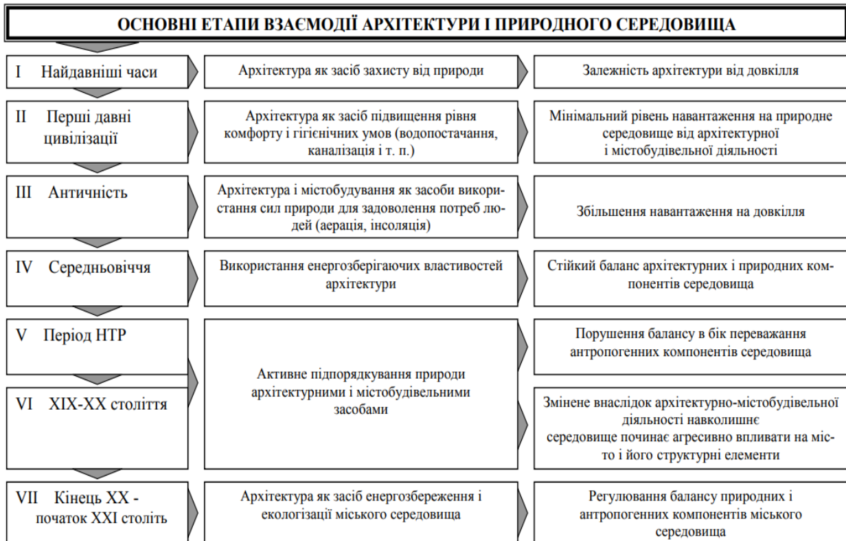
Рис. 1. Взаємодія архітектури і природного середовища на різних етапах історичного розвитку