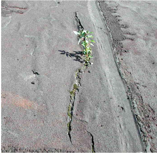
Рис. 4. Поява рослин та моху в тріщинах покрівлі