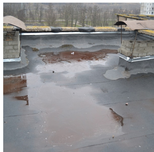
Рис. 3. Скупчення води на існуючій рулонній покрівлі