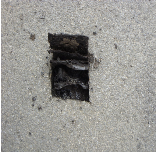
Рис. 7. Наявність неприбраних шарів під новоукладеними

На першому етапі здійснюється вивчення та аналіз усієї проектною документації з визначенням обсягів робіт узгоджених проектних рішень і кошторисної документації, в частині застосованих розцінок у локальних кошторисах для визначення кошторисної вартості реконструкції або ремонту покрівлі.