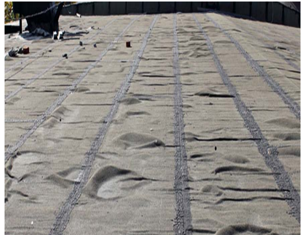
Рис. 1. Візуальний дефект покрівлі – здуття покрівельного килима

– протікання біля воронки внутрішнього водостоку.