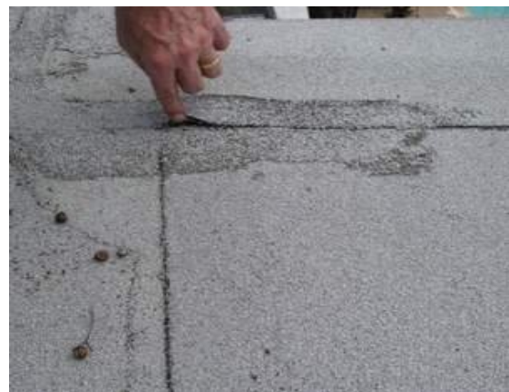
Рис. 2. Відшаровування в зонах напусту килима