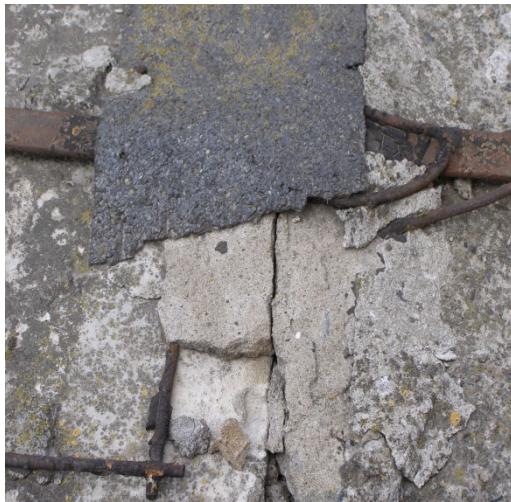
Рис. 5. Порушення ізоляції стиків між парапетними плитами