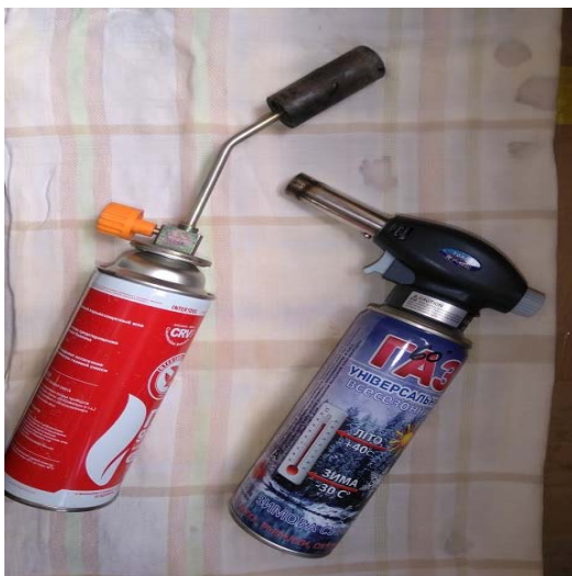
Рис. 8. Мініпальники, що використовуються для заклеювання розтину килима

На другому етапі здійснюється вивчення та аналіз усієї виконавчої документації і звітних документів: довідок про вартість виконаних підрядних робіт (форма КБ-3); актів приймання виконаних підрядних робіт (форма КБ-2в); актів на приховані роботи; підсумкових відомостей ресурсів, протоколів лабораторних випробувань, журналів та ін.