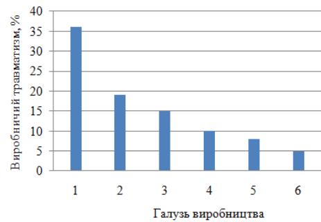
Рис. 3. Аналіз відсоткового співвідношення основних причин нещасних випадків, пов'язаних із виробництвом, в Україні в 2017 році: 1 – ДТП; 2 – падіння, обвалення, обвал предметів, матеріалів, породи, ґрунту тощо; 3 – падіння потерпілого; 4 – дія предметів і деталей, що рухаються, розлітаються та обертаються; 5 – ураження електричним струмом; 6 – вибухи (7 %, що залишилися, припадають на інші причини, пов'язані з виробництвом)

Аналіз літературних та статистичних джерел показав, що за останні роки відсоткове співвідношення основних причин виникнення нещасних випадків, пов'язаних із виробництвом у промисловості України перебуває практично в сталому стані. Так, на рисунку 3 наведено аналіз відсоткового співвідношення основних причин виникнення нещасних випадків, пов'язаних із виробництвом, в Україні в 2017 році [10].