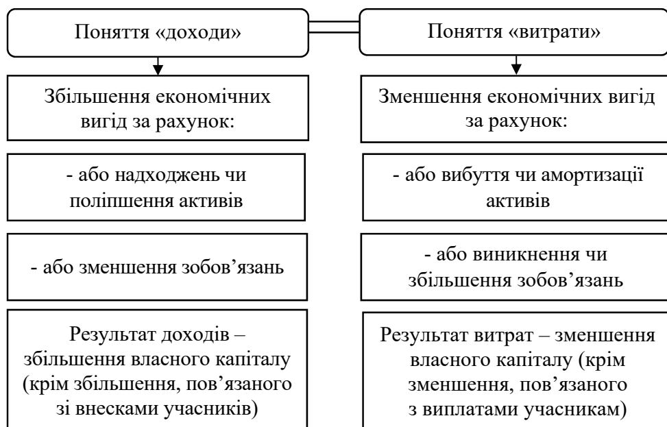
Рис. 1. Порівняння складових частин понять «доходи» та «витрати»

складовими частинами нижчого рівня. Наприклад, доходи від кредитів можна структурувати за кредитами, наданими фізичним та юридичним особам, кредитами за рівнем ризику, строками або напрямками кредитування. Схематично підходи до класифікації доходів і витрат банку наведені на рис. 2.