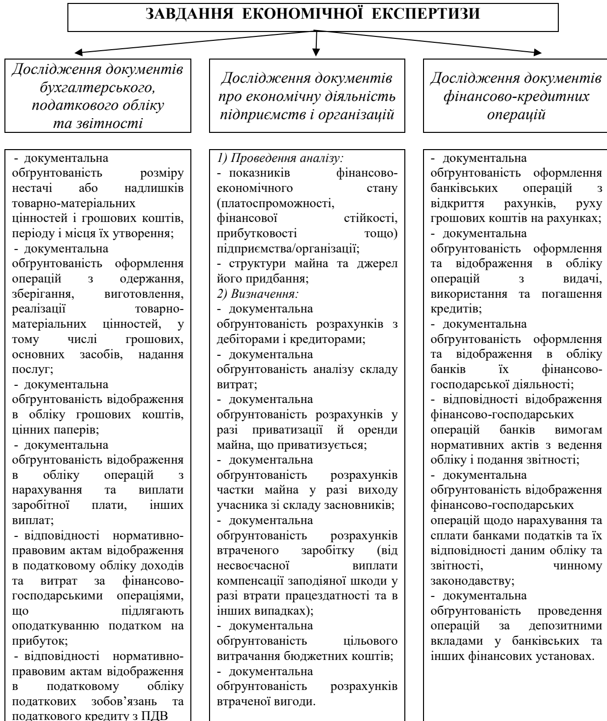
Рис. 2. Завдання економічної експертизи