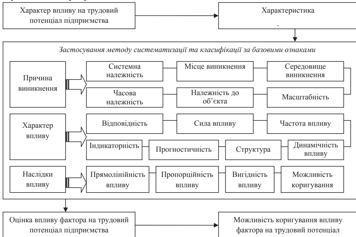
Рис. 2. Базові ознаки класифікації факторів впливу на формування та розвиток трудового потенціалу підприємства

За третьою ознакою «наслідки впливу» виокремлено чотири критерії та групи факторів впливу на трудовий потенціал підприємства: прямолінійність впливу (прямі, непрямі); пропорційність впливу (прямо пропорційні, обернено пропорційні); вигідність впливу (лімітуючі, стимулюючі); можливість коригування (регульовані, частково регульовані, нерегульовані).