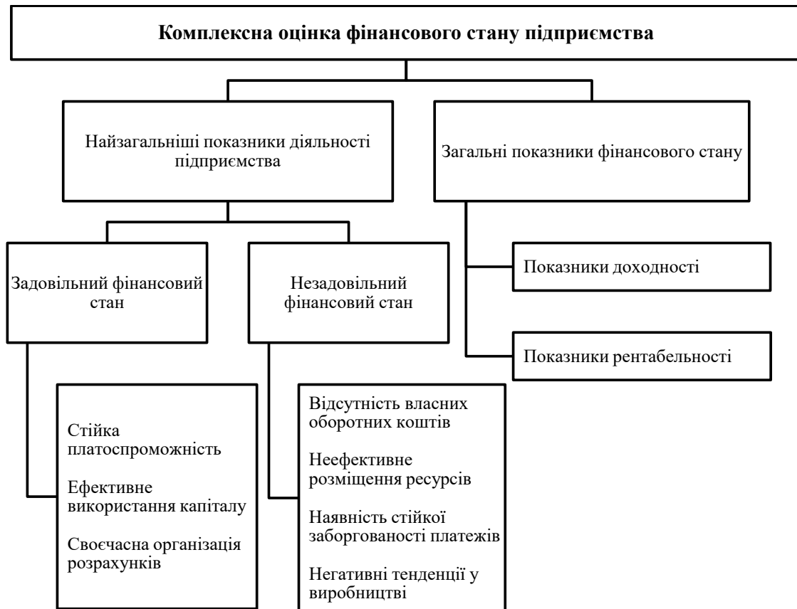
Рис. 1. Показники комплексної оцінки фінансового стану підприємства