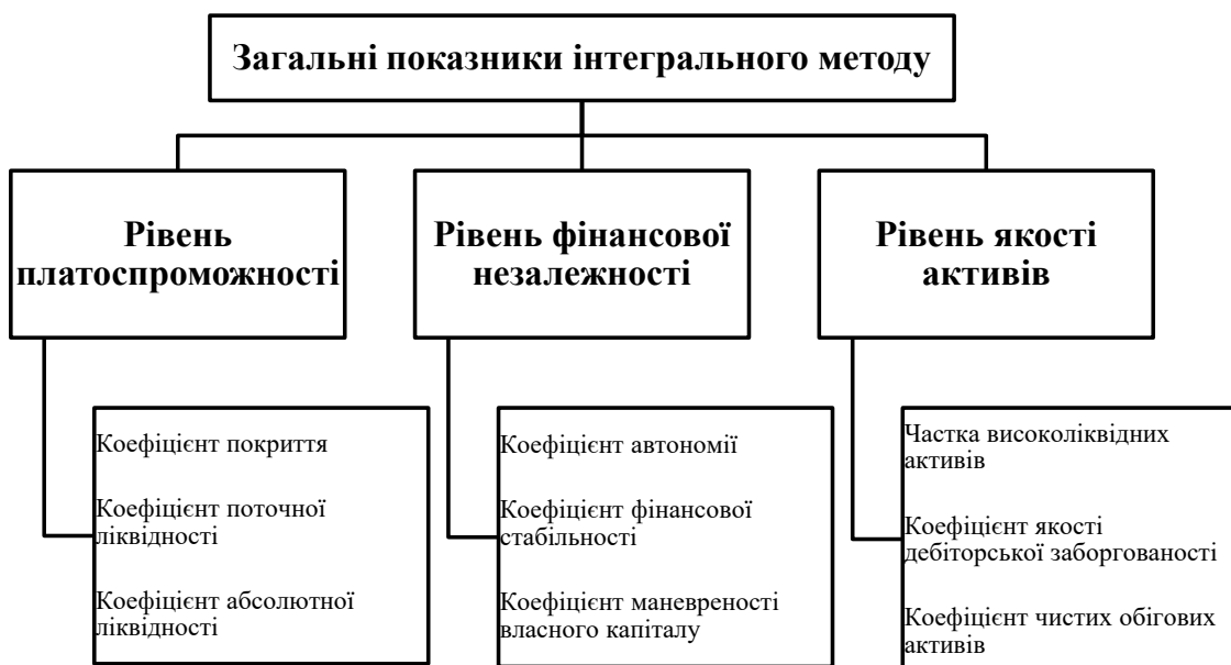
Рис. 2. Загальні показники інтегрального методу

приємства і розробити відповідні рекомендації загального характеру для досягнення фінансово-господарської рівноваги у разі відхилення підприємства від лінійної рівноваги чи зони безпеки, що є дуже цінним під час використання саме цього методу [6]. Однак метод має свої