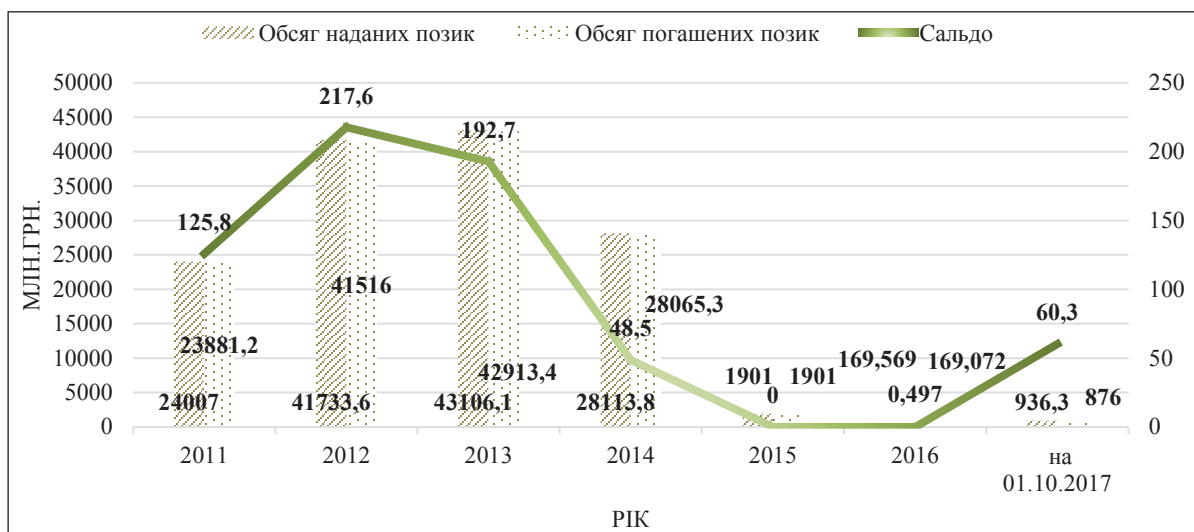
Рис. 1. Обсяги наданих та погашених позик з ЄКР за 2011–2017 роки

Касове збалансування доходів і видатків місцевих бюджетів суттєво впливає на виконання покладених на місцеві органи самоврядування завдань, до яких входять своєчасність виплати заробітної плати працівникам бюджетної сфери, розрахунки за використані енергоносії, комунальні послуги, фінансування всіх передбачених бюджетом видаткових повноважень. У разі,