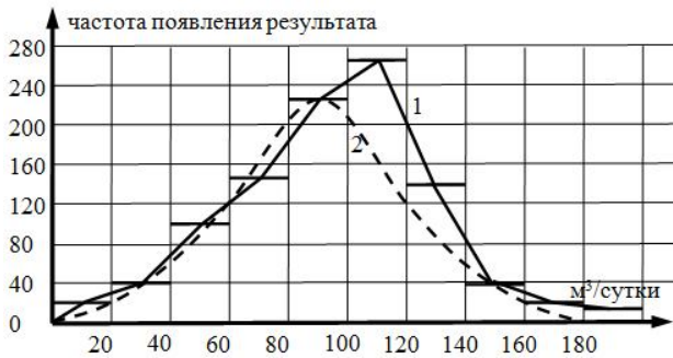
Рис. 1. Графики фактического (1) и теоретического (2) распределения вероятностей интенсивности монтажа