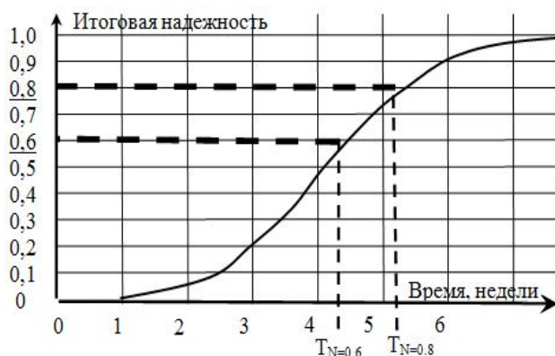
Рис. 3. Итоговая функция времени окончания работ Fig. 3. The final function of the work completion time

предусматривает увеличение этих сроков по отношению к детерминированным расчетам.