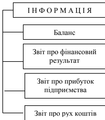
Рис.1. Інформаційне забезпечення бази даних «Аналіз»

На другому етапі проходить визначення інформаційного забезпечення яке представлено на рис. 1.