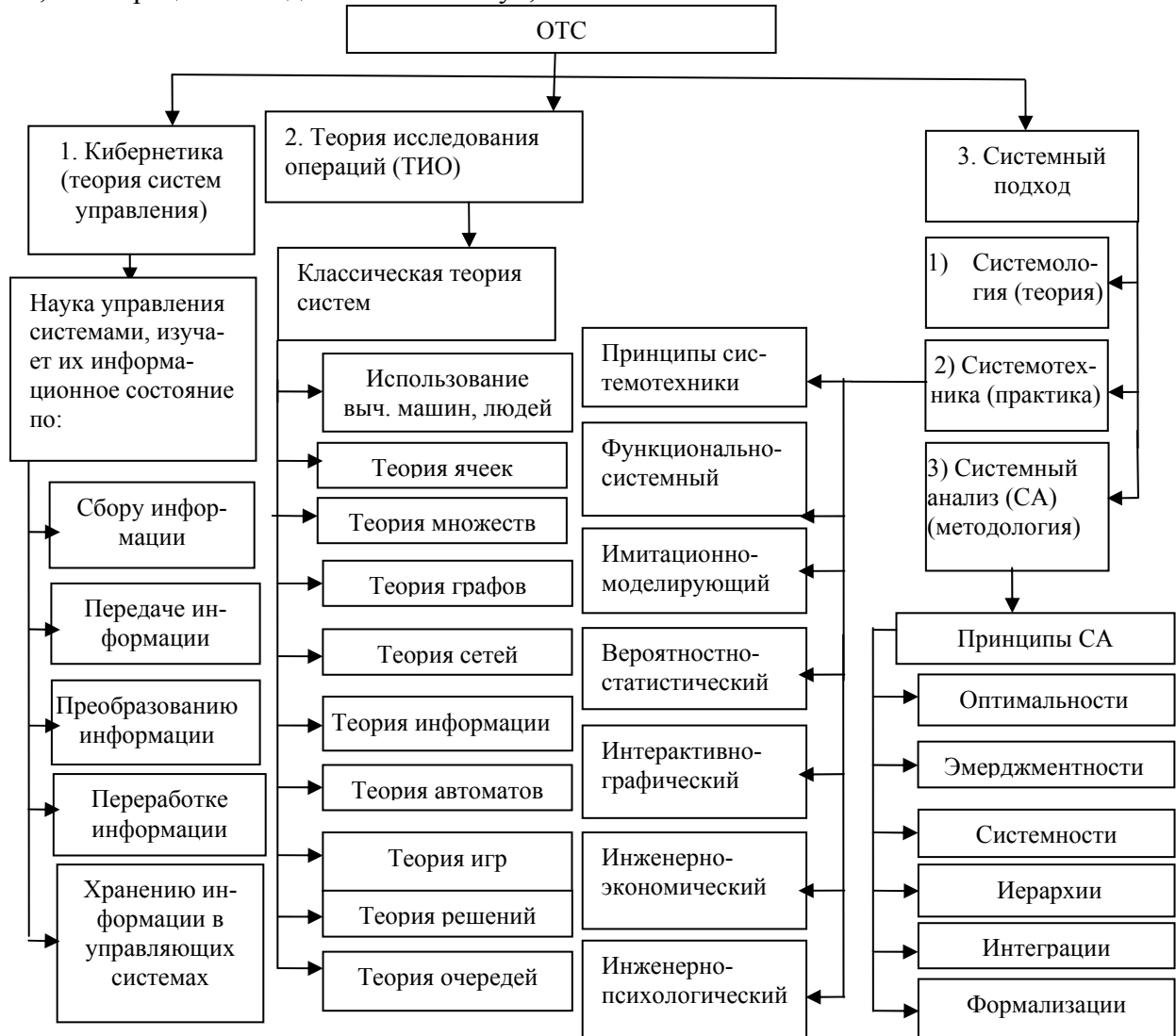
Рис. 1. Структура ОТС (по Л.фон Берталанфи)

специалистов – инженеров, экономистов, социологов, философов, психологов. Здесь важно понимание смысла общности гносеологических и логических устоев вместо многообразия наук.