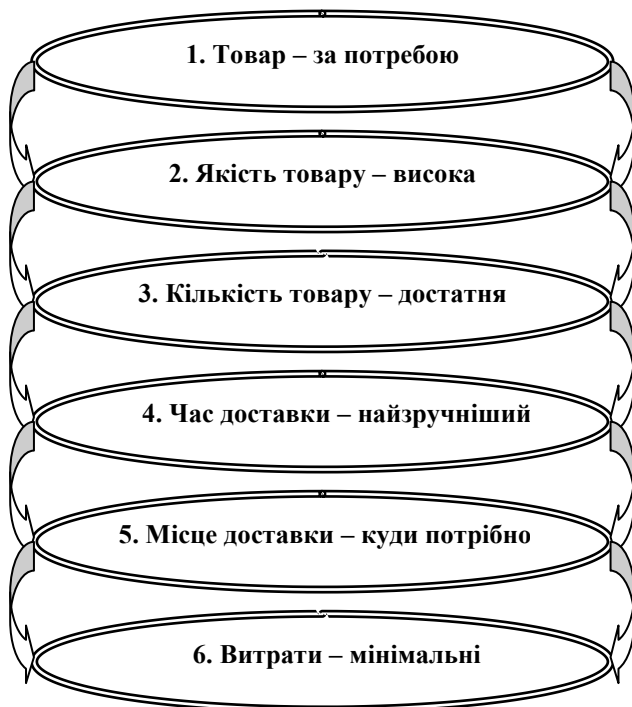
Рис. 3. Шість правил логістичного управління

При цьому управління логістичними процесами на підприємстві має здійснюватися за певними правилами (рис. 3).