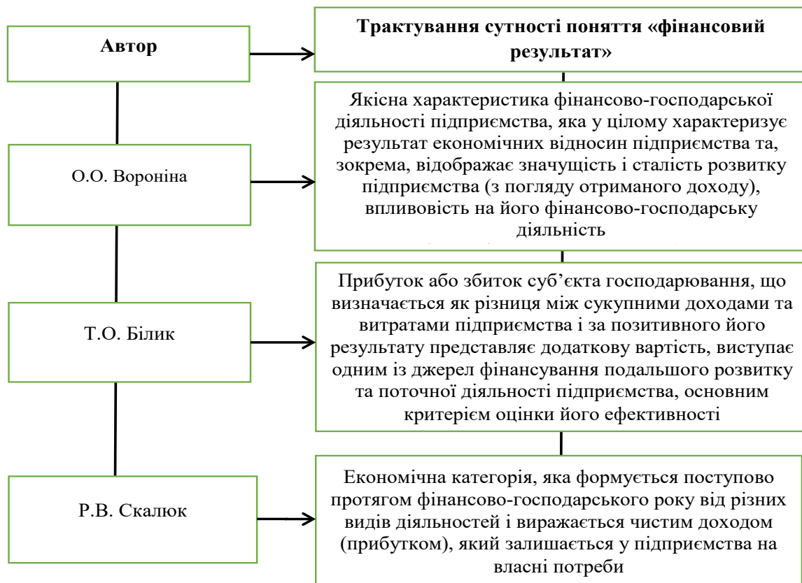
Рис. 1. Сутність категорії «фінансовий результат» (економічний аспект) [14, с. 230]

Метою виконання іншого завдання – зниження витрат – є планування, аналіз, оцінка та