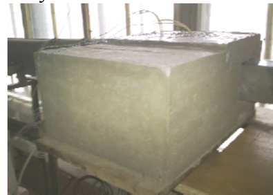
Рис.2. Вигляд експериментальної установки / View of the experimental device

На рисунку 2 показано вигляд експериментальної установки.