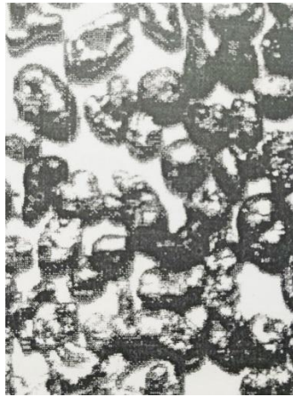
Рис. 1 Общий вид гранул основной фракции, \times 16 / Fig. 1. General view of granules of the main fraction, \times 16