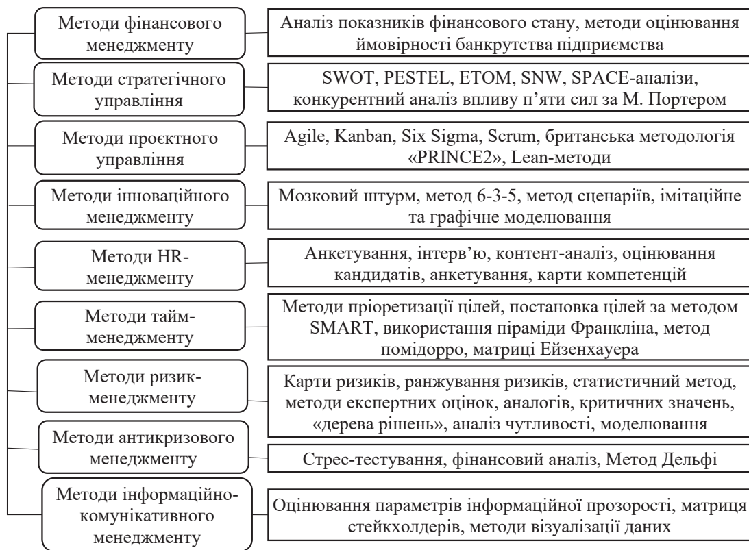
Рис. 2. Складові методології досліджень проблем менеджменту у контексті стратегічного управління економічною безпекою підприємств