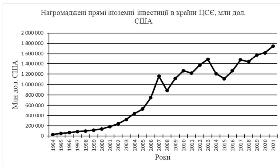
Рис. 1. Динаміка нагромадження прямих іноземних інвестицій в країни Центральної та Східної Європи в 1994–2021 роках

Загалом, можемо зробити певні висновки щодо динаміки структури У післякризовий період 2009–2021 роки спостерігається значне зростання середнього значення запасу прямих іноземних інвестицій до 41,2% і зменшення більше, ніж у два рази волатильності притоків ПІІ, який склав 5,2, а також зростання в 1,5 рази портфельних іноземних інвестицій і кардинального зменшення волатильності цього виду іноземного капіталу до 2,69. Щодо інших інвестицій, то вони залишились на докризовому рівні, але волатильність зменшилась на чверть.