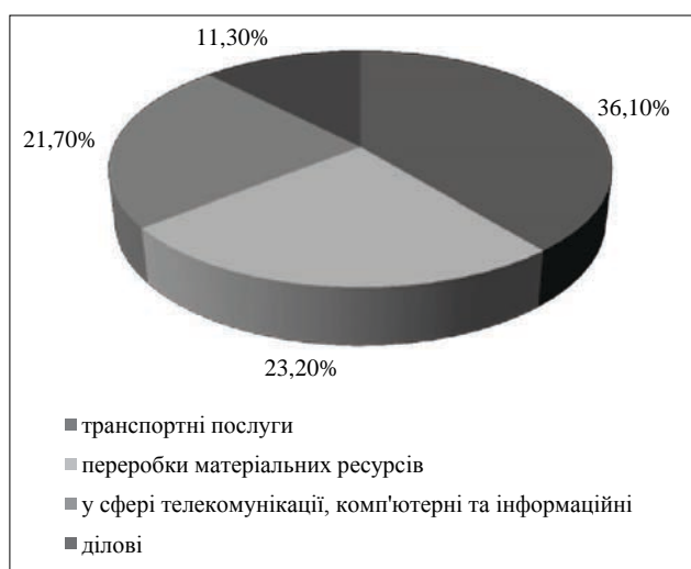
Рис. 2. Найбільші експортні послуги з України до країн – партнерів ЄС

– полімерні матеріали, пластмаси – 1 365,9 млн. дол. США;