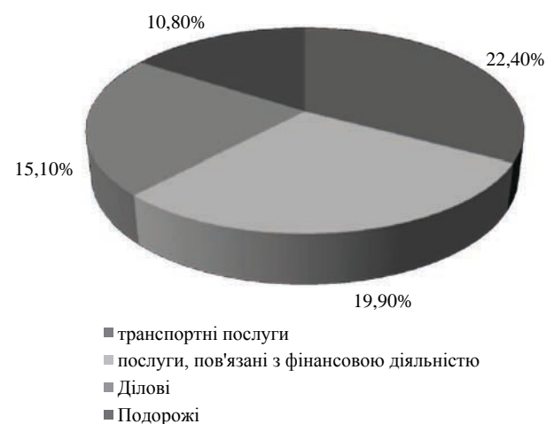
Рис. 4. Найбільші імпортовані послуги з ЄС до України, 2016 р.