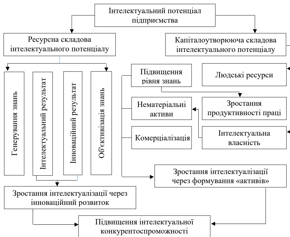
Рис. 2. Структура системи інтелектуального потенціалу підприємства