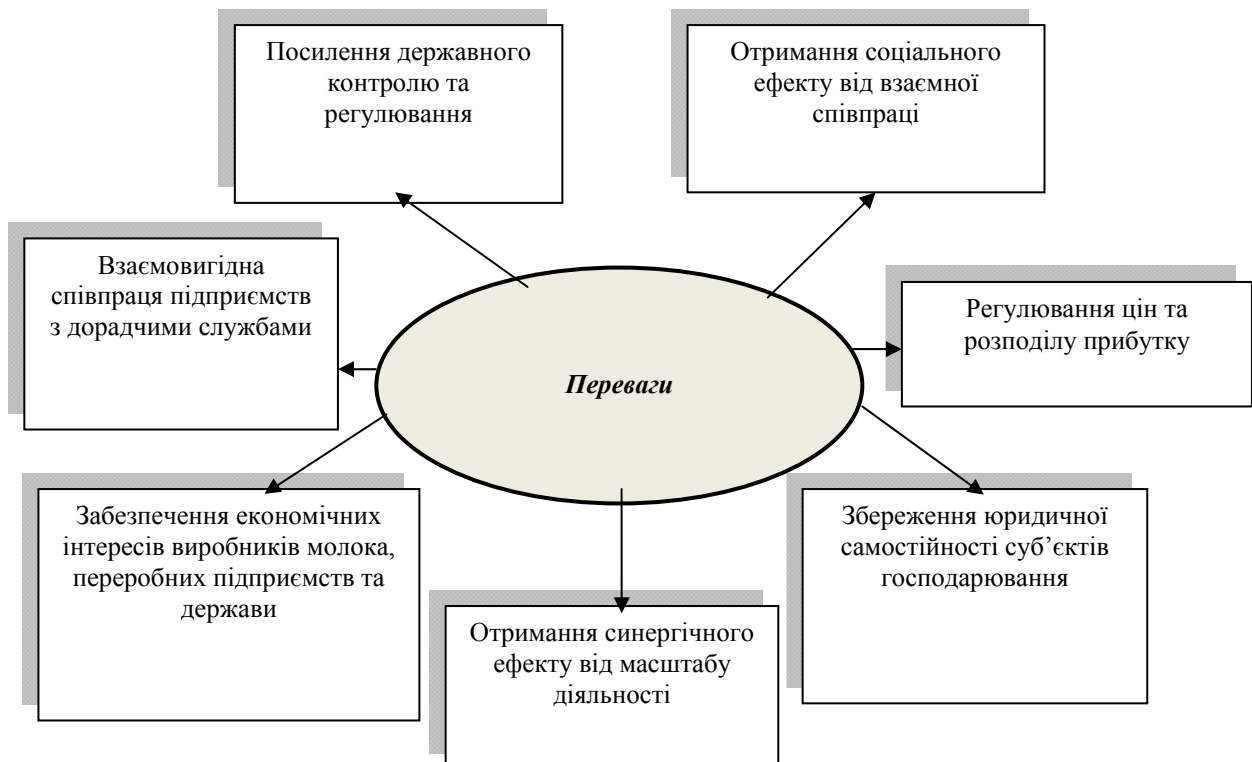
Рис. 3. Переваги створення конвергенційної моделі організації регіонального молокопродуктового підкомплексу АПК

Переваги запропонованої організації регіонального молокопродуктового підкомплексу АПК наведені на рис. 3.