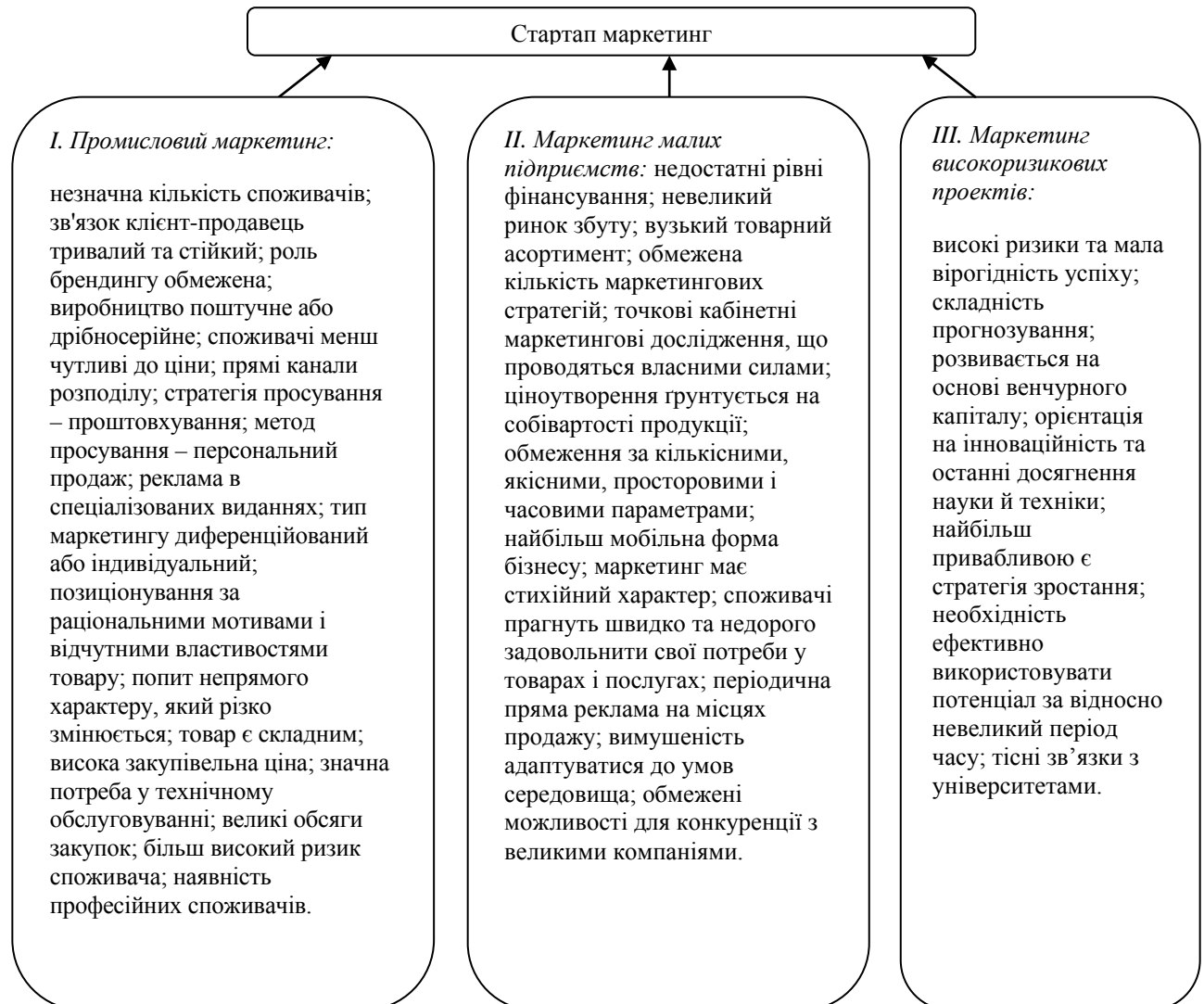
Рис. 1. Теоретичне підґрунтя маркетингу стартап-проектів на промисловому ринку

морфологічного аналізу, методом Делфі та методом SCAMPER [2]. Після цього проводиться попередній маркетинговий аналіз та висувається ряд гіпотез.