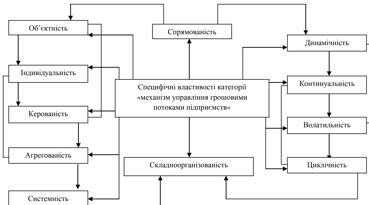
Рис. 1 Специфічні властивості категорії «механізм управління грошовими потоками підприємств» та взаємозв'язки між ними Розроблено автором

На рис. 1 наведено графічну візуалізацію специфічних властивостей категорії «механізм управління грошовими потоками». До них належать системність (сукупність елементів, що разом функціонують як єдина цілісна система), динамічність (рух цілої системи та її окремих елементів), агрегованість (поєднання для загального функціонування), волатильність (можливість змінності та постійна зміна співпраці та співвідношення елементів системи механізму під впливом як внутрішніх, так і зовнішніх факторів тощо), індивідуальність (притаманність кожному суб'єкту господарювання власного унікального механізму управління грошовими потоками), керованість/суб'єктність (наявність суб'єкту управління та суб'єктивних відносин з керуючим органом), об'єктність (те, на що направлена діяльність суб'єкта – керована система), складноорганізованість (механізм управління грошовими потоками є складноорганізованою системою із наявними ієрархічними, гетерархічними та циклічними взаємодіями), спрямованість (вектор на досягнення мети, результату діяльності), циклічність (притаманність циклів, що повторюються та трансформуються у невизначених умовах господарювання), континуальність (постійне, безупинне функціонування системи, її елементів та груп елементів).