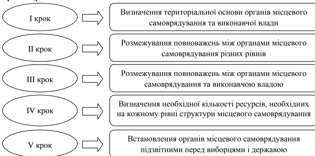
Рис.1. П'ять кроків проведення децентралізації влади

Проведення цієї політики передбачається зробити у п'ять кроків (рис. 1).