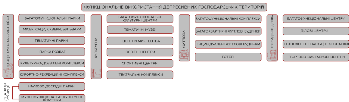
Рис. 2. Функціональне використання депресивних господарських територій

Депресивні території є потенційним резервом розвитку інших міських функцій (ландшафтно-рекреаційної, туристичної, житлово-громадської), а при значних розмірах – створення технополісів, технопарків, інноваційних кластерів; вони у структурі природокористування займають своєрідну нішу деградованого промислового ландшафту, який вимагає санації, рекультивациі та обґрунтованого використання в інших цілях. Нижче наведено таблицю можливих функцій використання депресивних господарських територій (рис. 2) [2].