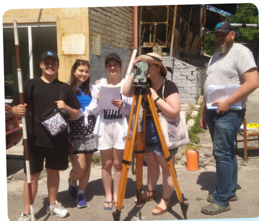
гр. ТГПВ-22 та ВВ-22, ф-т ЦтмаЕ