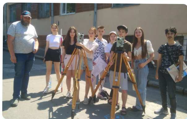
гр. АРХ-1,2 Архітектурного ф-ту