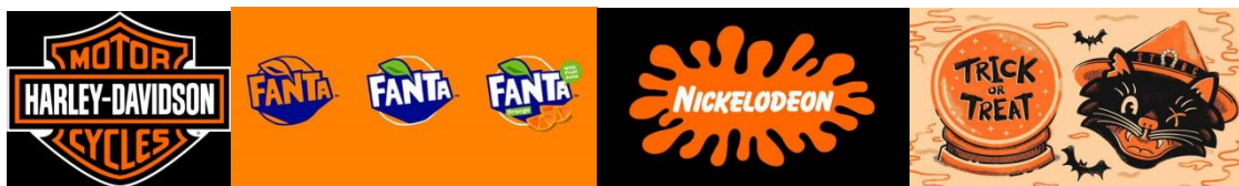
Рис. 1. Помаранчевий колір у рекламі

Що означає помаранчевий колір? Які почуття він викликає? Помаранчевий може бути дуже сильним і енергійним кольором. Як жовтий і червоний, він може дуже привертати увагу, тому, мабуть, його часто використовують у рекламі (рис. 1).