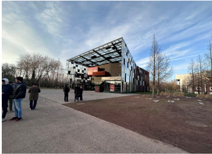
Рис. 2. Метафон, Уані, Франція

21 грудня 1990 року останній вугільний седан був символічно доставлений до шахти 9, таким чином завершивши 270 років видобутку в регіоні Нор-Па-де-Кале. Хоча його знищення було заплановане, 9-9bis було врятовано завдяки діям асоціації ACCUSTO SECI, що складається з колишніх шахтарів та ентузіастів, що призвело до класифікації будівель як історичних пам'яток у 1994 році. [2]