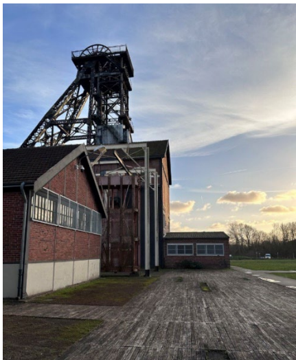
Рис. 1. Реконверсія шахти 9, Уані, Франція

Шахта 9 тепер є елементом спадщини та одним з основних воріт до гірничодобувного басейну, який внесений до списку Всесвітньої спадщини ЮНЕСКО. Це точка відкриття виняткової спадщини та ландшафту: гірничодобувних каркасів і відвалів.