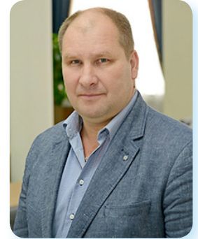
Старший викладач кафедри Фізичного виховання і спорту