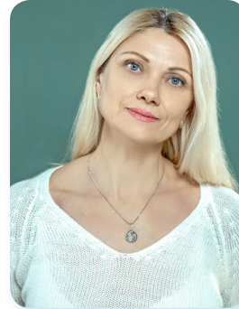
Завідувачка музеєм історії ПДАБА