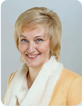
Д.е.н., професорка, завідувачка кафедри МЕтаПУА

Реєкторат, профком, Студентська рада, редакція газети «Мб»