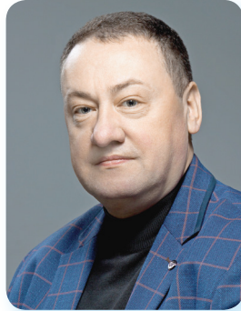
К.т.н., заступник директора з навчально-методичної роботи ННІОТ