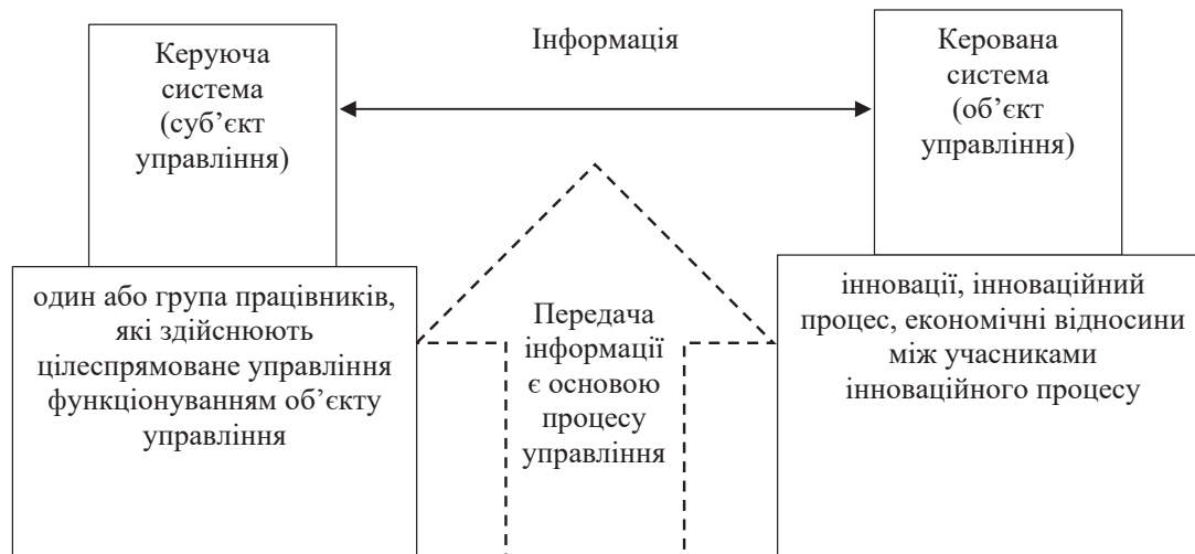
Рис. 1. Схема управління інноваційною діяльністю підприємства