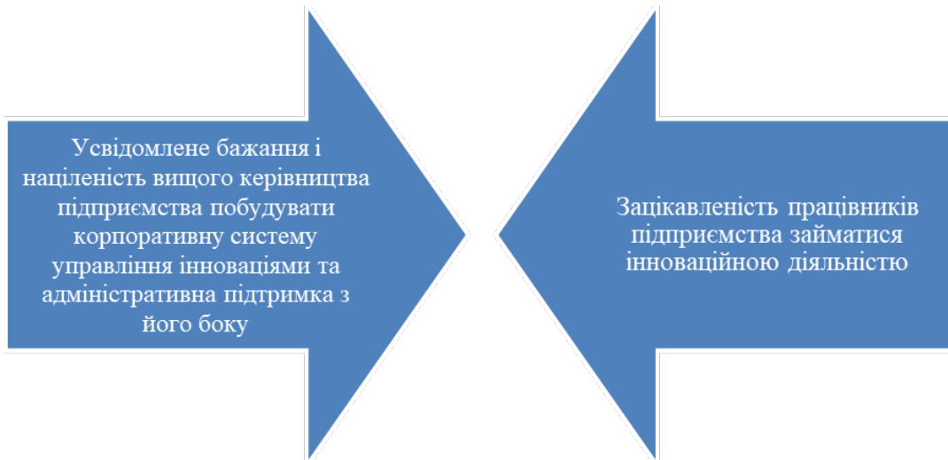
Рис. 3. Передумови ефективного впровадження технологічних інновацій на підприємстві

розвитку суспільства, науково-технічному прогресу, вимогам клієнтів у забезпеченні їх очікувань відповідно до потреб та інтересів.