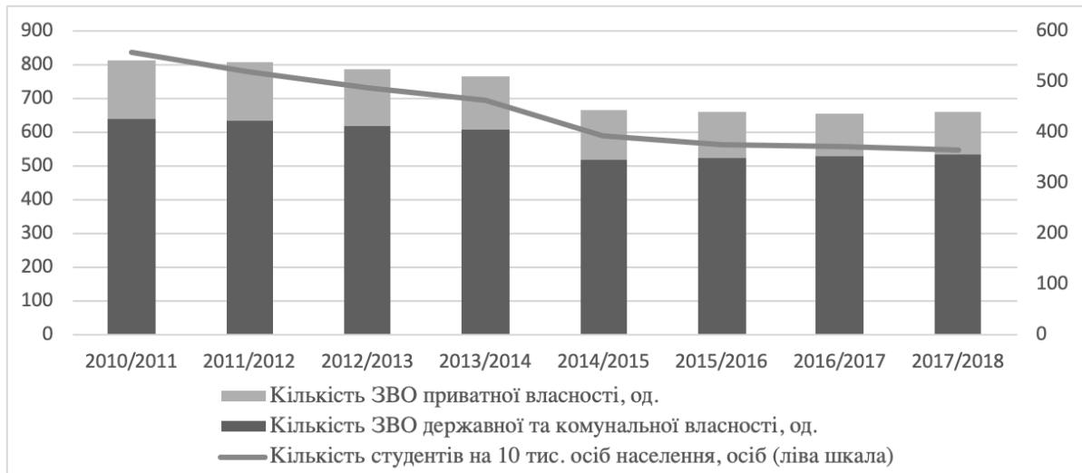
Рис. 1. Показники кількості ЗВО України у 2010-2017 рр.

Виклад основного матеріалу. Як свідчать показники ЗВО України у 2010-2017 рр., їх кількість кожен рік скорочується, проте зменшується також і кількість студентів у існуючому населенні, що може свідчити не тільки про негативні тенденції демографічного скорочення, а й про низьку мотивацію молоді до здобуття вищої освіти (рис. 1).