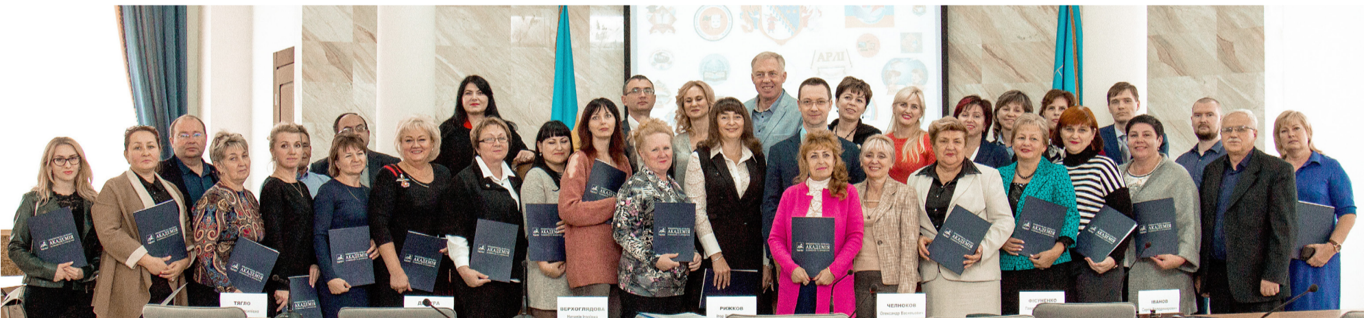
Угоди про співпрацю підписано з 35 закладами загальної середньої освіти

Дніпропетровське відділення Малої академії наук України бажає всім терпіння, наснаги і вдосталь часу, щоб наші спільні старання принесли найкращі результати.