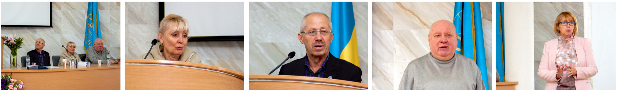
Президія урочистого свята