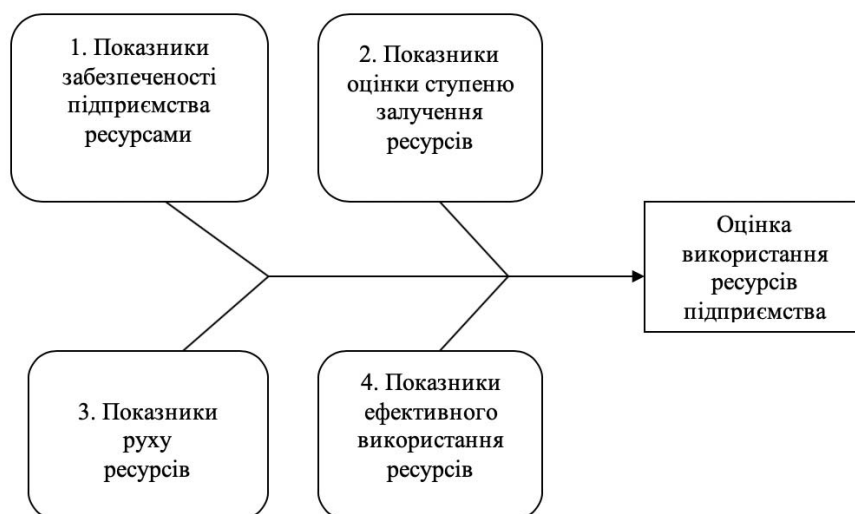
Рис. 2 Система показників оцінки ефективності виробництва

Розглядаючи методики оцінки ефективності виробництва, запропоновано інтегрований підхід, який окреслить кількісні та якісні параметри. Групи показників оцінки використання ресурсів показано на рис. 2.