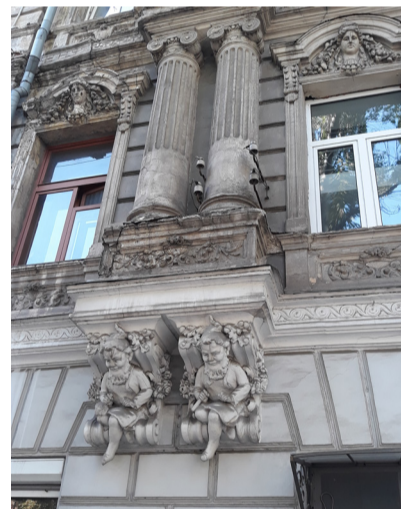
Будинок Штейна (будинок з гномами)