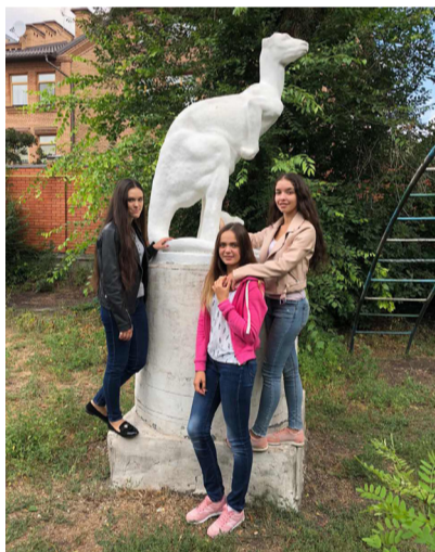
Скульптура кенгуру з малям