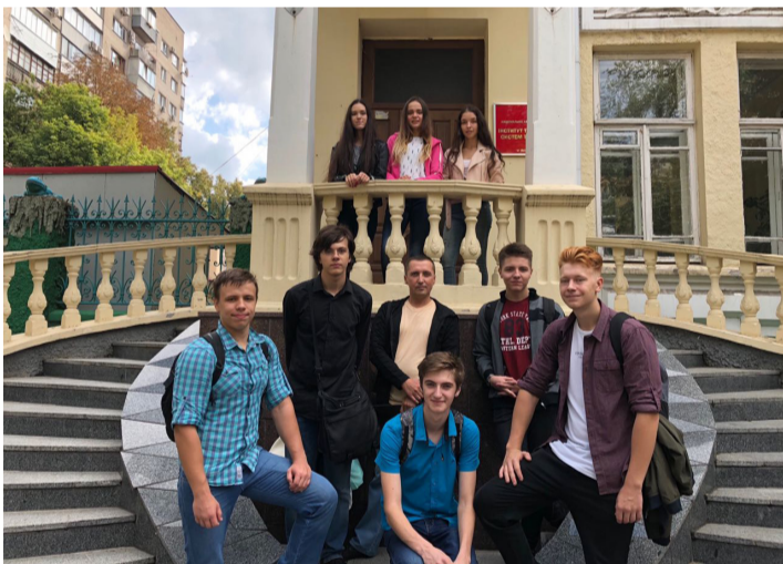
Будинок Емілія Вюрґлера (будинок з жабами)