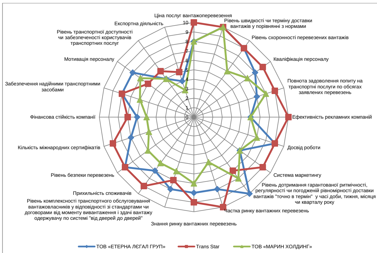
Рис. 2. Багатокутник конкурентоспроможності ТОВ «ЕТЕРНА ЛЕГАЛ ГРУП» на ринку міжнародних вантажних перевезень

Джерело: складено автором за експертними оцінками