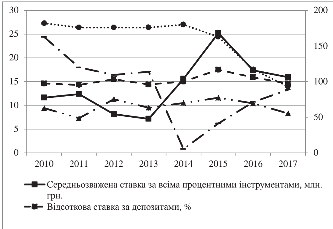
Рис. 1 Динаміка зміни показників функціонування банківського сектору в Україні за період 2010-2017 років

порівнянні із 182 у 2010), середньозважена ставка за всіма процентними інструментами з 2012 року зросла в двічі (16% у порівнянні з 8,13%), аналогічна нестабільна ситуація спостерігається і за рештою показників функціонування банківського сектору в країні, основні з яких наведені на рисунку 1.